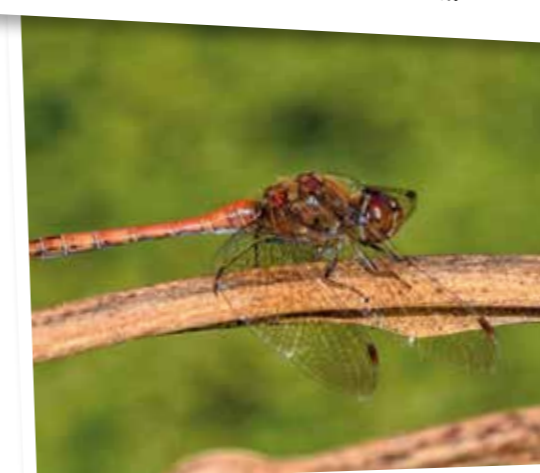
...en de mooiste libellen