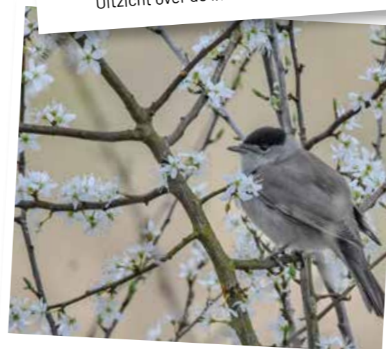
hier vind u ook Monnik grasmussen ...