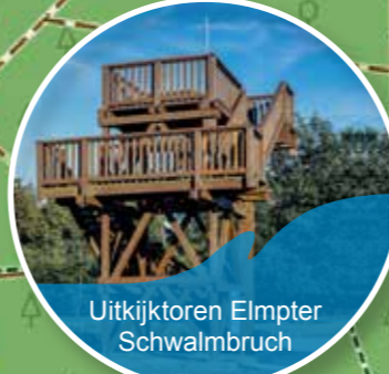
Uitzijktoren Elmpter Schwalmbruch