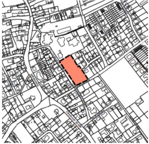
Abb. 2: Flächennutzungsplan Berichtigung