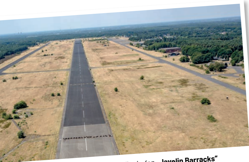
Ehemaliger britischer Militärflughafen „Javelin Barracks“

Den Rundwanderweg beginnen Sie direkt am Wanderparkplatz Hillenkamp in Elmpt. Folgen Sie dem Asphaltweg entlang des Zaunes, der den ehemaligen britischen Militärflughafen „Javelin Barracks“ umgibt.