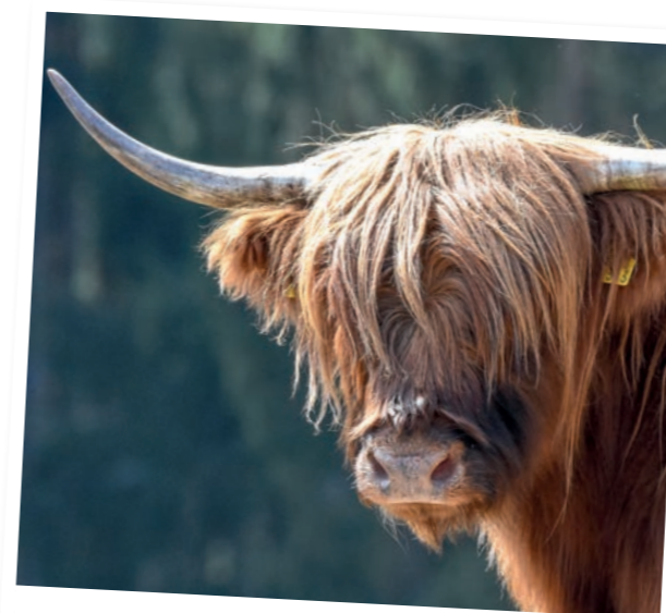
Zuständig für die Landschaftspflege: Hochlandrinder

Auf der niederländischen Seite gilt ein striktes Fahrradverbot zum Schutz von Schlangen.