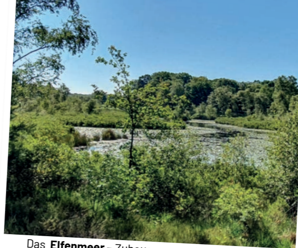
Das Elfenmeer – Zuhause verschiedener Molche und Froscharten

An der Kreuzungsmöglichkeit biegen Sie links ab. Sie wandern hier bereits entlang der deutsch-niederländischen Grenze. Sobald Sie das Drehkreuz durchschritten haben, befinden Sie sich in den Niederlanden. Folgen Sie dem Weg entlang der Heidelandschaft, um zum Elfenmeer zu gelangen. Über den Pfad durch die Heide erreichen Sie den Bohlenweg. Der Steg aus Holzbohlen führt Sie ein Stück über die Boschbeek, auch Buschbach genannt. Nutzen Sie den Bohlenweg, um auf den Pfad entlang der Boschbeekheide zu gelangen. Anschließend folgen Sie dem Weg durch den Wald, um zurück zum Wanderparkplatz Hillenkamp zu gelangen.